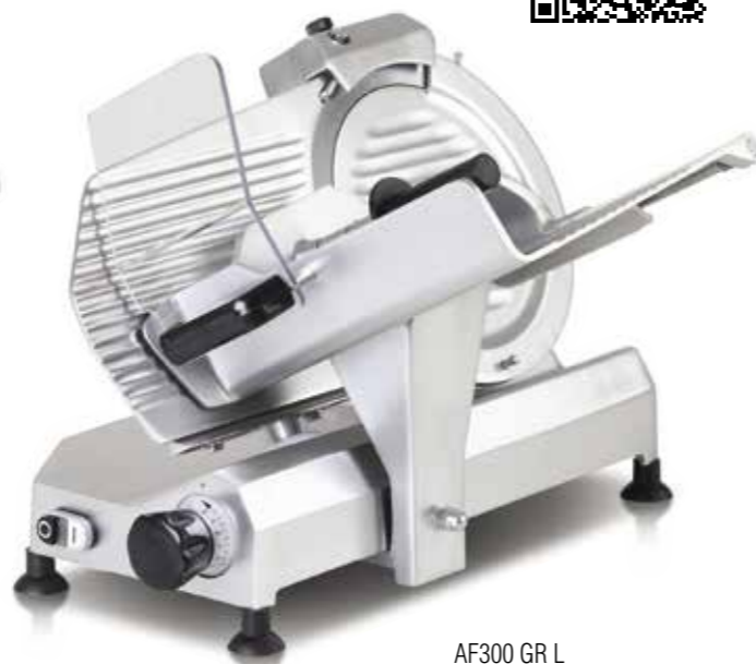
AF300 GR L